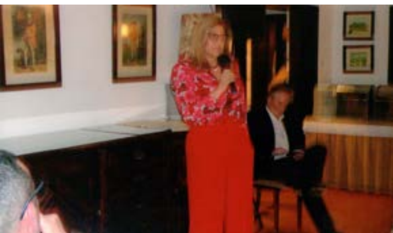
Também as senhoras “abriram o livro...”.