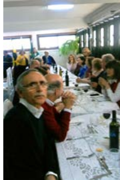
Um aspecto parcial do espaço para o almoço.