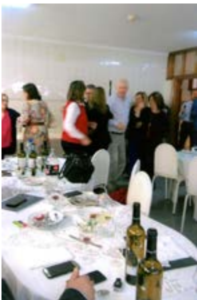
Houve mesmo quem desse um pezinho de dança!