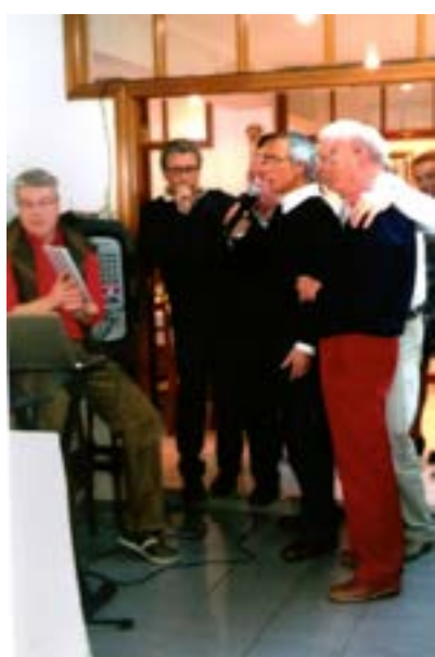
Houve desatada cantoria...