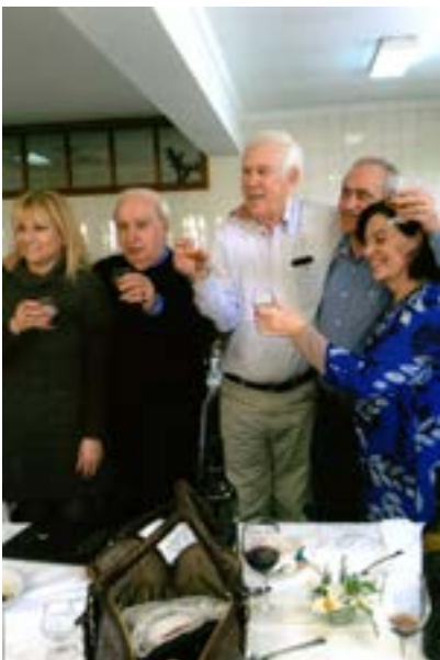
Boa disposição foi coisa onnipresente!