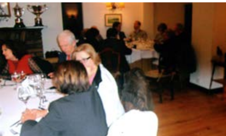
Um aspecto parcial da sala onde o evento decorreu.

Uma noite bem agradável, pois, uma iniciativa que, de largo, justifica que outras edições similares venham.