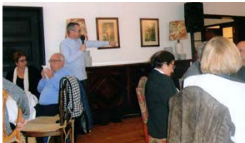
Um dos mais “activos”...