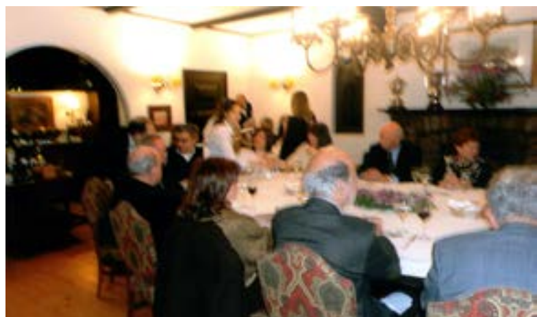
Um outro ângulo da dita.