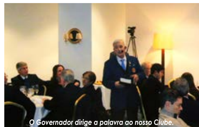
O Governador dirige a palavra ao nosso Clube.