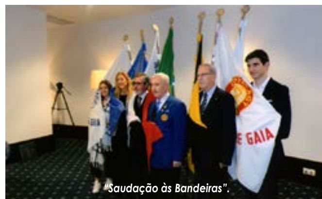
"Saudação às Bandeiras".