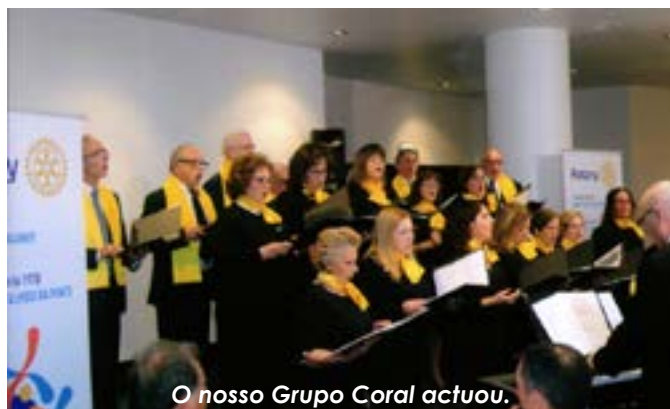
O nosso Grupo Coral actuou.