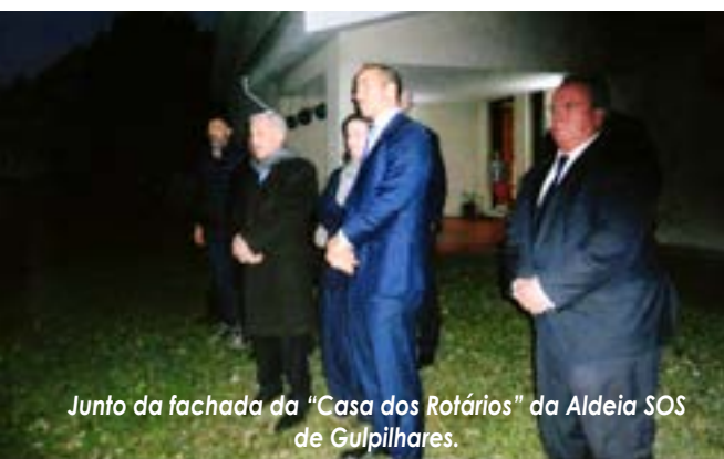
Junto da fachada da "Casa dos Rotários" da Aldeia SOS de Gulpilhares.