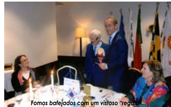
Fomos bafejados com um vistoso "regalo"...