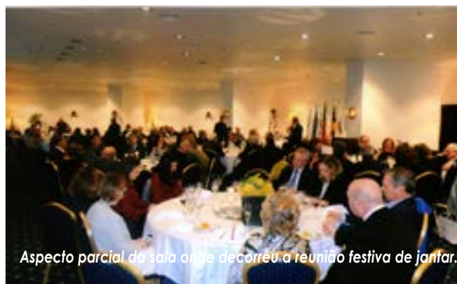
Aspecto parcial da sala onde decorreu a reunião festiva de jantar.