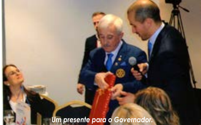
Um presente para o Governador.