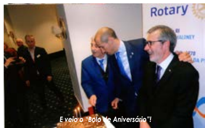
E veio o "Bolo de Aniversário"!