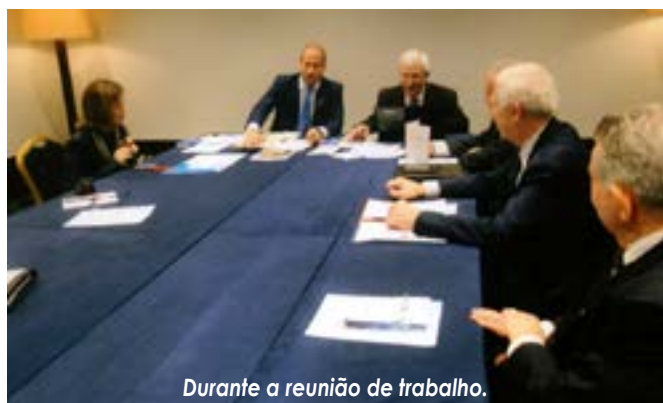
Durante a reunião de trabalho.