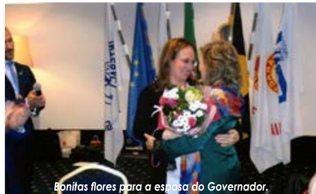
Bonitas flores para a esposa do Governador.