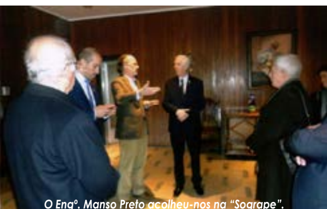
O Eng o . Manso Preto acolheu-nos na "Sogrape".