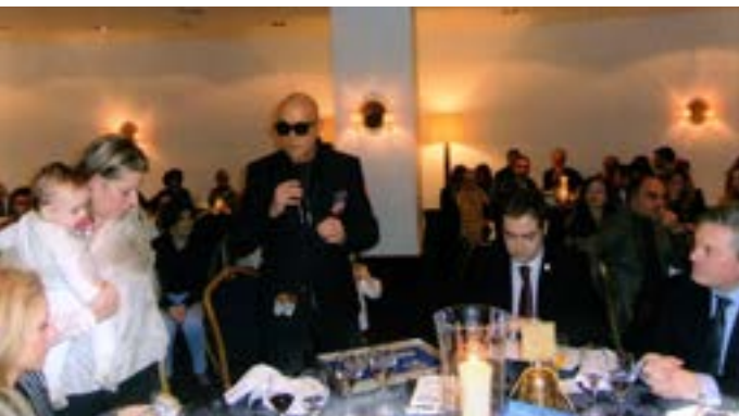
O homenageado agradece.