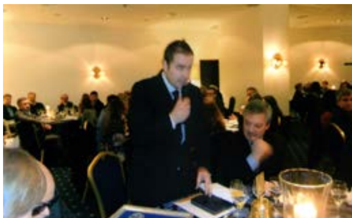
O Presidente justifica o significado da reunião.