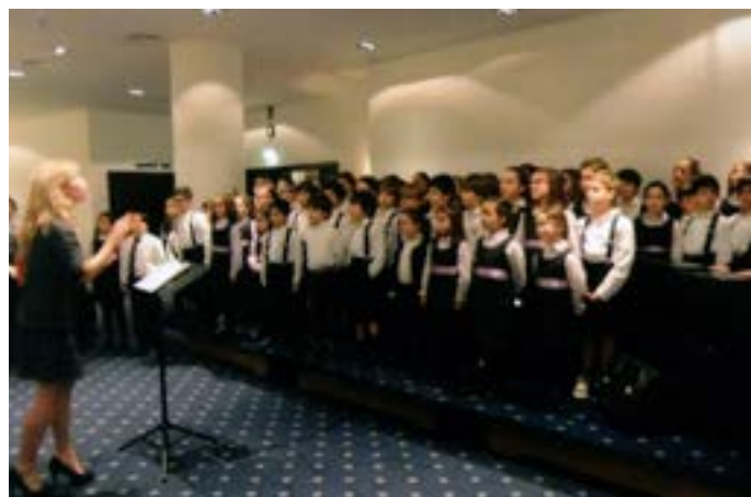
O Coral da Academia de Música de Vilar do Paraíso abre a festa.

Logo de entrada foi uma grata surpresa: o aparecimento na grande sala de 40 elementos do Coral Juvenil da Academia de Música de Vilar do Paraíso, meninas e meninos. Entoou (e com muito bom nível) duas das melodias mais conhecidas de Pedro Abrunhosa, que não conseguiu resistir à tentação de sair do seu lugar e ir cantar com os miúdos. Nada melhor para começar.