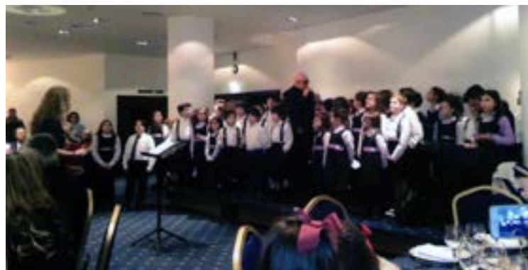
Pedro Abrunhosa partilha a sua música juntos das crianças.