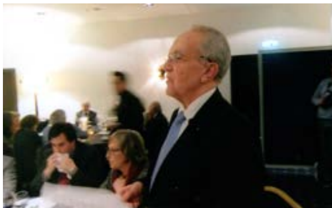
O "Protocolo" Compº Eurico Basto descreve o perfil profissional e humano de Pedro Abrunhosa.