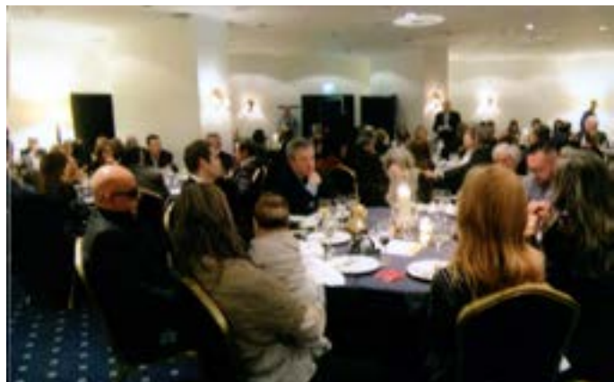
Um aspecto parcial da sala.