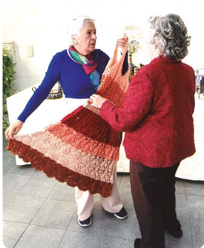
Houve sorteio de um vestido de “crochet”.

E lá se foram retirando, pouco-a-pouco, os convivas neste “magusto” que gerou um apoio de cerca de € 1.600,00 a favor da Instituição beneficiária ... além de ter beneficiado, e muito, o espírito de amizade e de