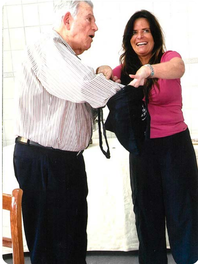
Quem ditou a vencedora foi o dono-da-casa...