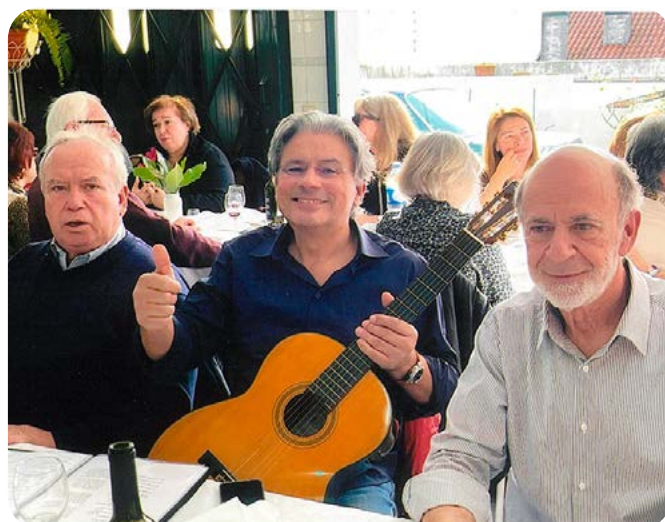
E igualmente as violas.