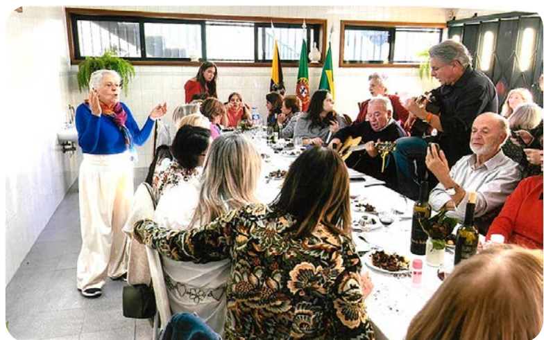
Foi constante a animação!