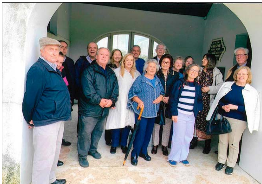
Posando no final da visita guiada à “Casa-Museu”.