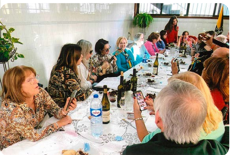
Os cavaquinhos fazem-se ouvir.