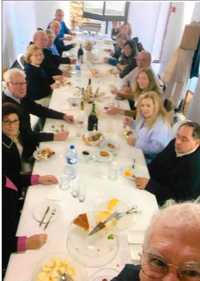
Ao almoço reinou a boa disposição...