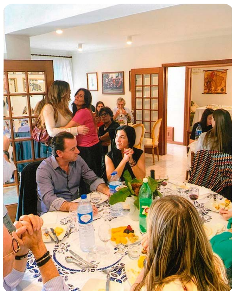
E, na sala anexa.