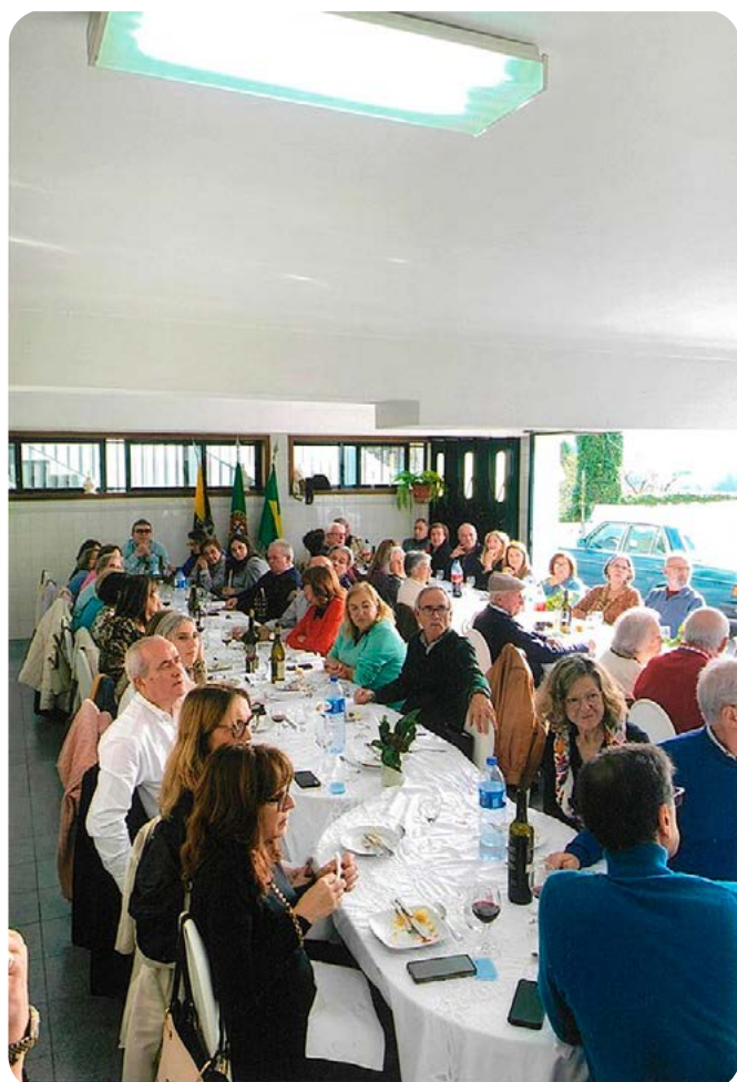
Aspecto parcial do amplo salão.