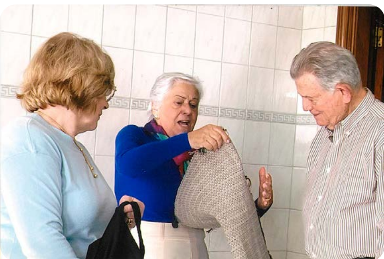
Um presente da tradição de Pardilhó.