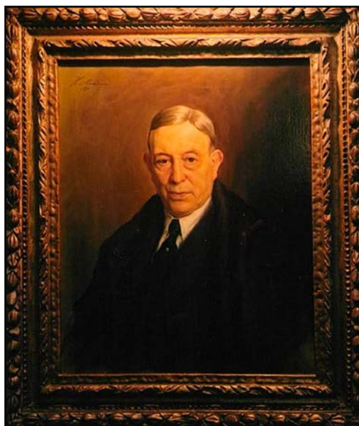
Retrato do próprio.

Era já atingido o meio da tarde quando, concluída a visita, se regressou a casa com todos muito agradados da jornada.