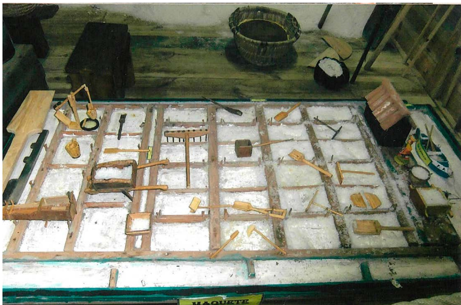
a seca nas salinas.

Tais barcos aliavam uma excelente capacidade de transporte a uma elevada capacidade de manobra, até porque eram de pequeno calado. Isso permitia-lhes navegar com facilidade pelos estreitos canais, ademais pouco profundos, que fazem a ligação de S. Pedro a Lavos, lá na planície salgada figueirense.