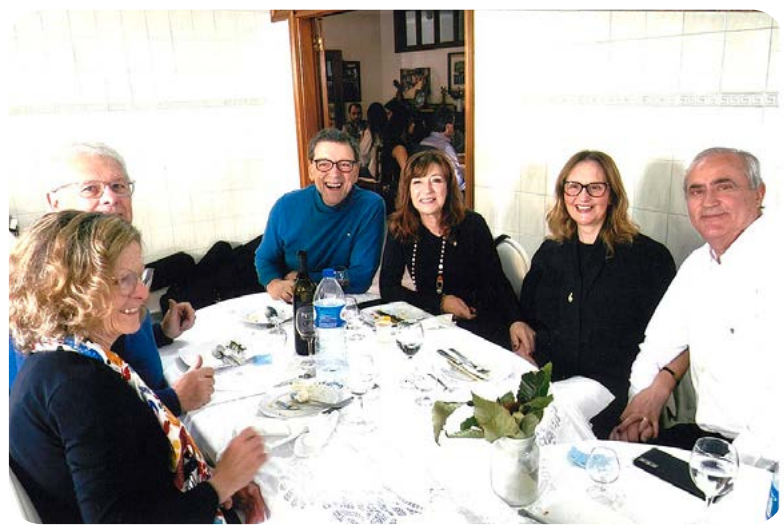
Os nossos bons amigos e Companheiros do Rotary Club de Gaia-Sul marcaram presença grata.