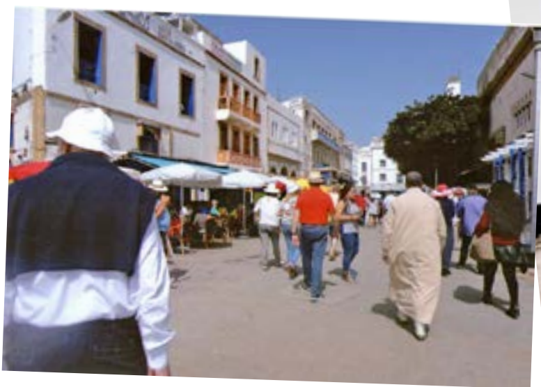
Numa rua de Essaouira.

Classificada como “Património da Humanidade”, Essaouira é uma cidade portuária encantadora na qual ainda resiste um pequeno forte, um tanto ao largo, construído pelos nossos ancestrais.