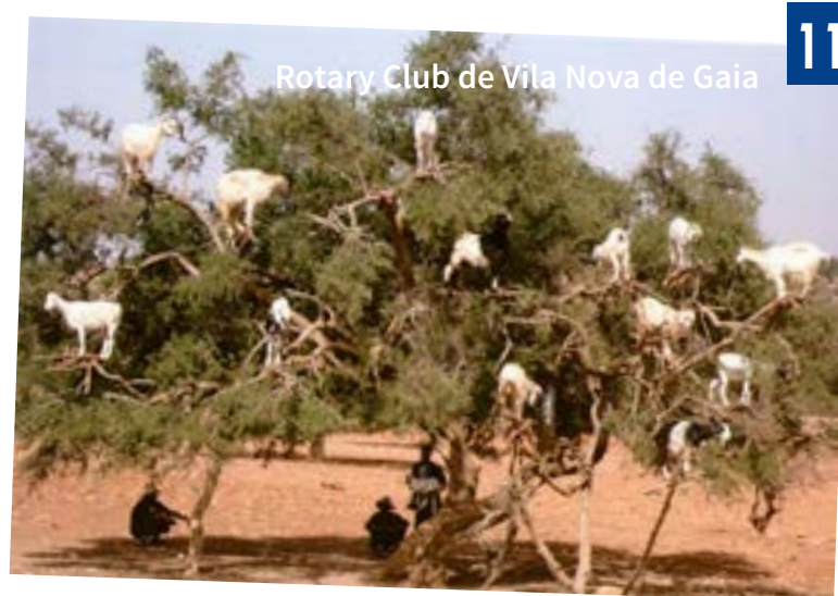
Cabras no arganeiro!!!???

No dia seguinte demandámos Essaouira por estrada, viagem que teve a espantosa surpresa de vermos cabras empoleiradas em arganeiras (as árvores que produzem argan, fruto oleaginoso). No caminho tivemos ensejo de pararmos numa cooperativa de produção do famoso óleo “Argan” e, além de vermos como ele se extrai artesanalmente, de adquirir alguns sofisticados produtos.