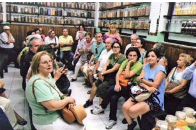
Na loja de produtos de cosmética.