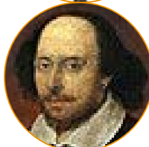
Milton Friedman (1902-2006)

"O mal da grandeza é quando ela separa a consciência do poder".