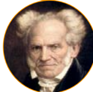
Abraham Lincoln (1809-1865)

"Não ir ao teatro é como fazer a toilette sem espelho."