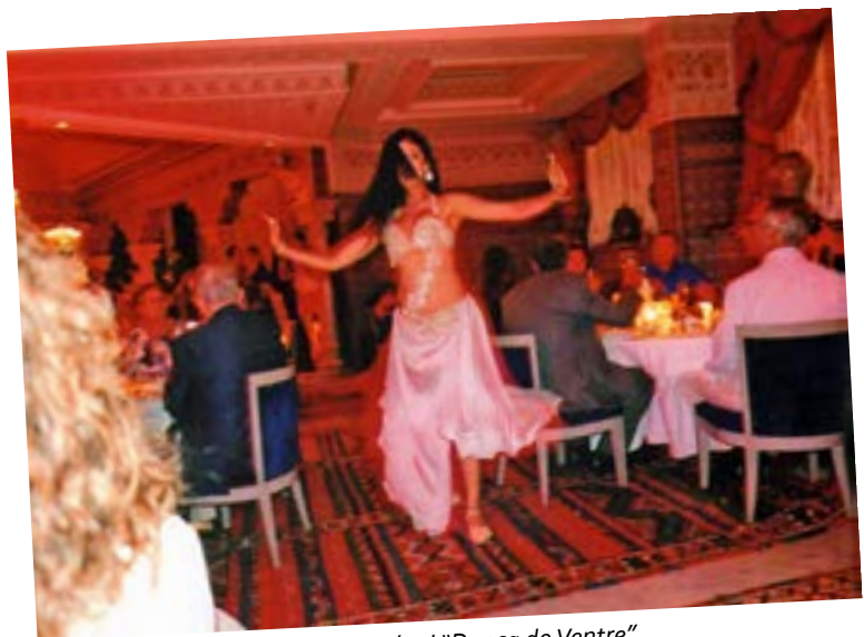
A incontornável "Dança do Ventre".