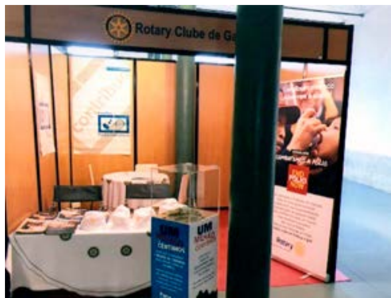
O nosso vistoso "stand".

Com a activa participação/colaboração dos nossos Companheiros do Interact Club ESAS-Vila Nova de Gaia, aproveitámos muito bem para sensibilizar tudo e todos quanto à Campanha de Erradicação Global da Polio e para angariar mais alguns fundos em apoio a ela, assim como para divulgar o Rotary mercê da distribuição larga de desdobráveis e de publicações rotárias.