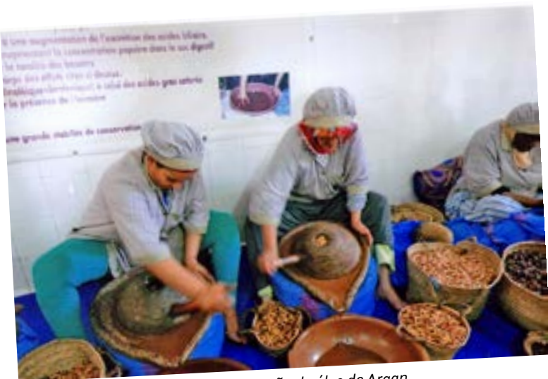
A extracção do óleo de Argan.

Classificada como “Património da Humanidade”, Essaouira é uma cidade portuária encantadora na qual ainda resiste um pequeno forte, um tanto ao largo, construído pelos nossos ancestrais.