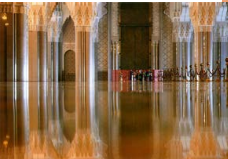
Interior da Mesquita Hassan II.

partida entre Marrocos e o Gabão a contar para o apuramento para a fase final do Campeonato do Mundo que se disputará em Moscovo no ano que vem. Todo o Marroquino que se preze estava altamente interessado pelo jogo e era decisiva uma vitória de Marrocos... Com veio a acontecer e deu ruidosa festa durante toda a noite.