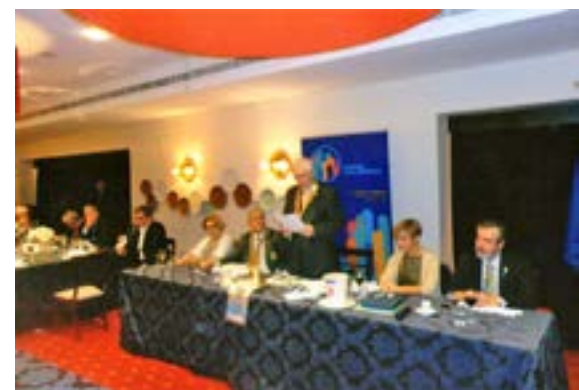
- O nosso Presidente diz de sua justiça...