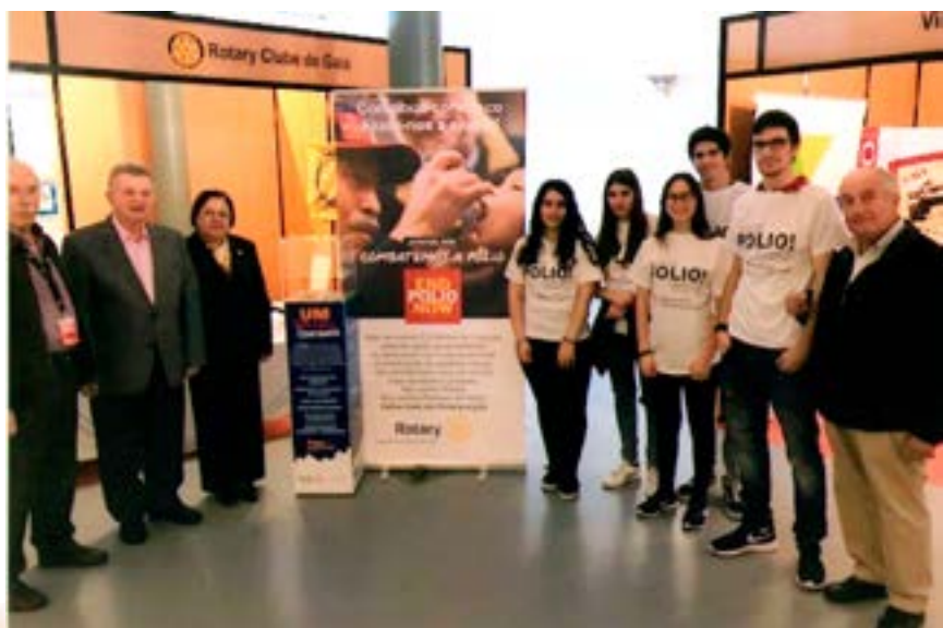
E... vamos a isto...