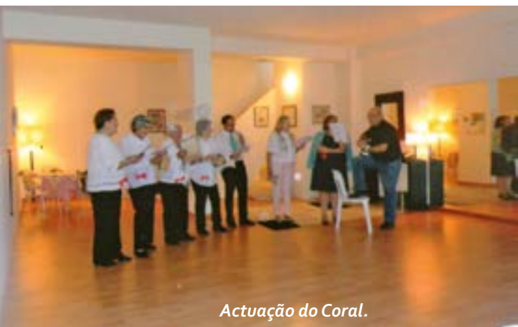
Actuação do Coral.