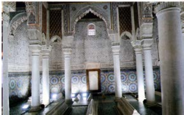
Os túmulos Sadia.