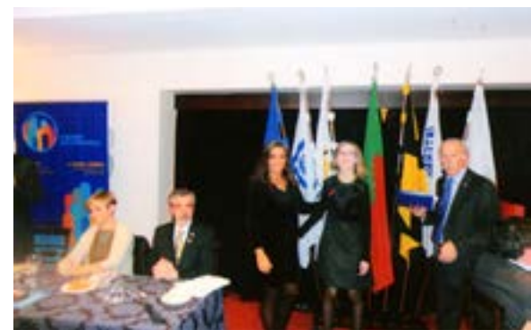
... assim como a Comp a . Ana Povo.