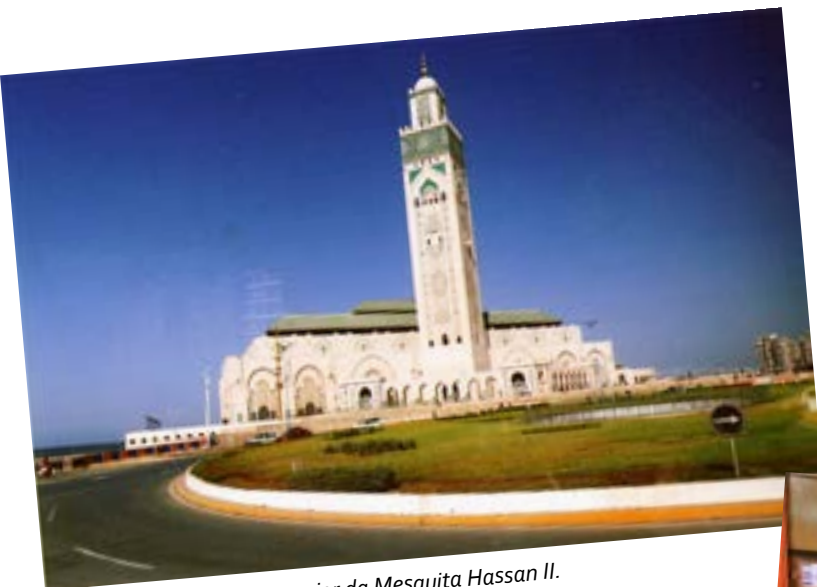
Exterior da Mesquita Hassan II.

partida entre Marrocos e o Gabão a contar para o apuramento para a fase final do Campeonato do Mundo que se disputará em Moscovo no ano que vem. Todo o Marroquino que se preze estava altamente interessado pelo jogo e era decisiva uma vitória de Marrocos... Com veio a acontecer e deu ruidosa festa durante toda a noite.