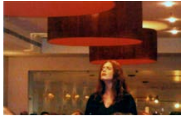
O Momento Musical.