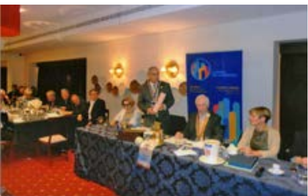
Na sua alocução final fala o nosso Governador,