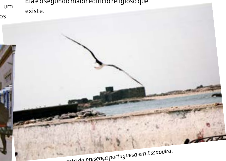
O que resta da presença portuguesa em Essaouira.

Após um rápido almoço “tant bien que mal” numa esplanada atlântica, dirigimo-nos para a Mesquita Hassan II, verdadeiramente esplendorosa, gigantesca e de ímpar beleza. Com guia que nos aguardava, percorremo-la e admirámos aquele singular monumento que, como imposição corânica, foi edificado de tal sorte que uma terça parte da sua área “assenta” no mar. A dimensão dos seus espaços e a riqueza dos materiais utilizados na construção são assombrosas. Com 200 ms. de altura no minarete, a Mesquita é o mais alto templo do mundo e tem capacidade para 25.000 fieis no seu interior. No exterior cabem 80.000. Ela é o segundo maior edifício religioso que existe.