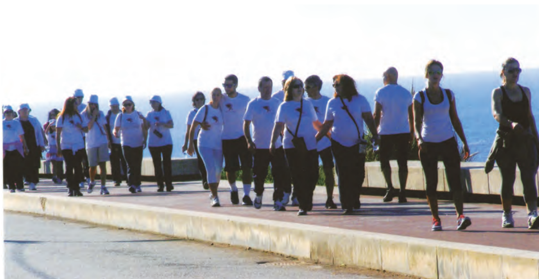
A alongada fila dos participantes.