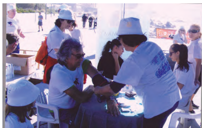
Ora vamos lá ver como anda essa tensão...

O dia 8 de Novembro foi, por assim dizer, escolhido a dedo para albergar a Caminhada que recebeu o título desta breve nota. Um sol quente como que de verão, ligeiríssima brisa marítima a afagar na zona de Canidelo e prosseguindo para montante do Douro. Um cenário portentoso.