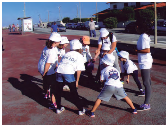
Até a “pequenada” teve de fazer os que mais lhe quadravam.

As “discorrências” residiram sobretudo no facto de, ao mesmo tempo, se realizarem outras caminhadas nas cercanias, porém com outras motivações: uma outra Caminhada Solidária da iniciativa da “Refood”, também ali próximo do nosso “terreno”, e, já no Porto, a Maratona adicionada com uma Meia-Maratona e ainda outras corridas pedestres.