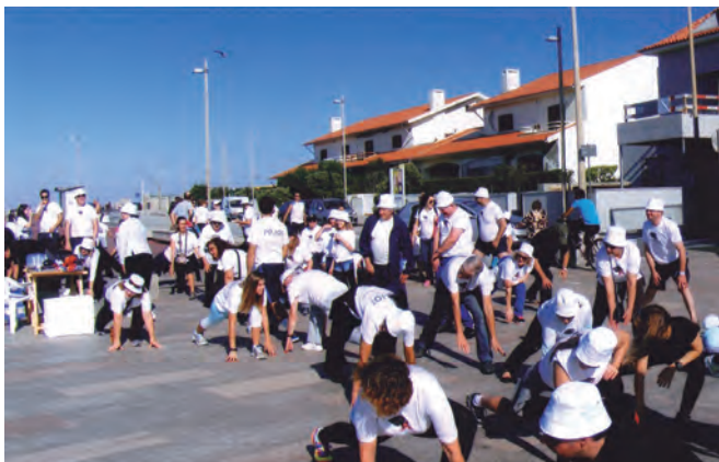
Vá lá: esticar bem!...

Por isso a participação que almejávamos atingir teve de ficar aquém do que pretendíamos, mas não deslustrou a cerca de centena e meia dos que estiveram a palmilhar connosco os 5 kms. da nossa prova: de em frente do “Casa Branca” até ao início da marina da Afurada.