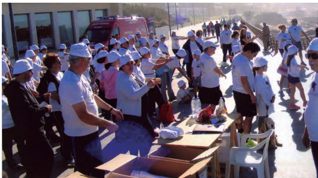
Nos exercícios de aquecimento.

Mas outras entidades se nos juntaram para que fosse possível e tivesse o melhor alcance esta Caminhada. Logo à cabeça, a Liga dos Amigos do Centro Hospitalar de Gaia, com toda a sua parafrenália de equipamentos para realização de rastreios quer de medição da tensão arterial, quer dos níveis