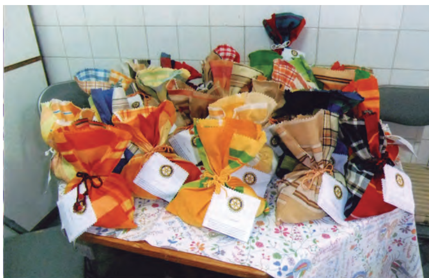
Os saquinhos de castanhas que a Miita preparara.