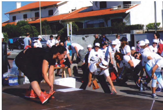
No final, os alongamentos.

Por isso a participação que almejávamos atingir teve de ficar aquém do que pretendíamos, mas não deslustrou a cerca de centena e meia dos que estiveram a palmilhar connosco os 5 kms. da nossa prova: de em frente do “Casa Branca” até ao início da marina da Afurada.