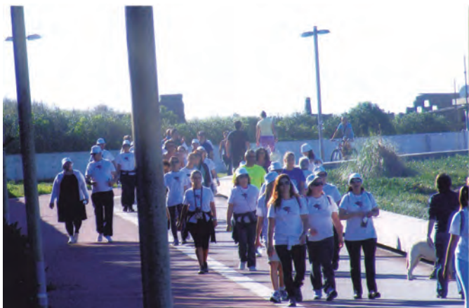
Já a cerca de meio do percurso.