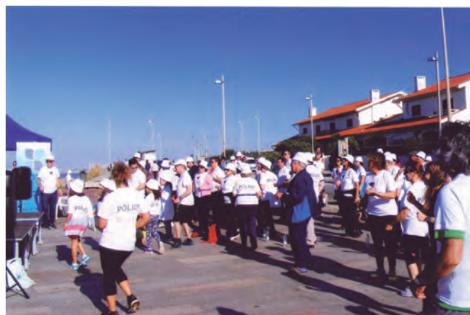
E aí vai toda a gente a caminho da marina.