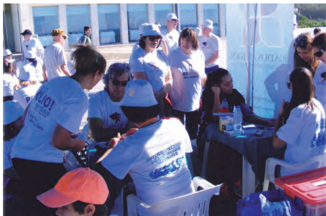
Na bancada das equipas da Liga dos Amigos do Centro Hospitalar de Gaia não havia mãos a medir na realização dos rastreios.