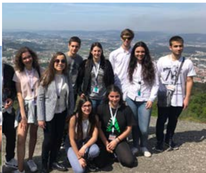
Alguns dos RYLISTAS posam.