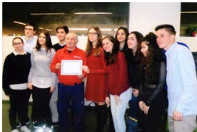
No final um Diploma de Reconhecimento e uma ajuda aos Bombeiros Voluntários do Porto.