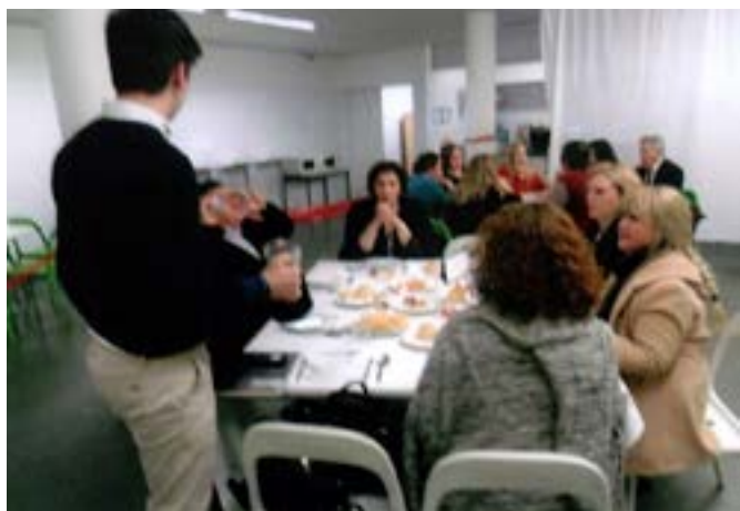
Um aspecto parcial da Sala.

Todos os Interactistas produziram um magnífico trabalho de solicitude e gentileza, de plena eficácia, proporcionando o Clube um excelente serviço de jantar de estupendo companheirismo. E quase meio milhar de Euros foram logo entregues aos Bombeiros na pessoa do seu representante.