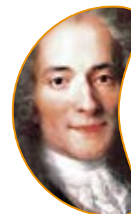
Albert Einstein (1879-1955)

"Um dia tudo será excelente, eis a nossa esperança; hoje tudo corre pelo melhor, eis a nossa ilusão".