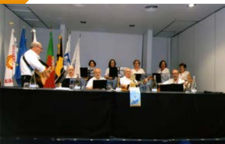
No momento musical actuam os elementos do Grupo de Violas e Cavaquinhos da Universidade Senior do Rotary em Matosinhos.