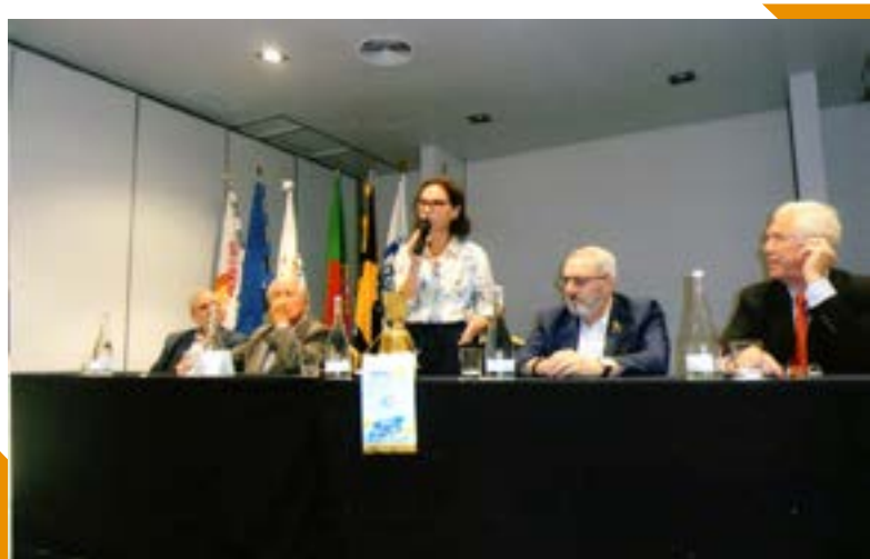
Nas palavras introdutórias, fala a nossa Presidente.