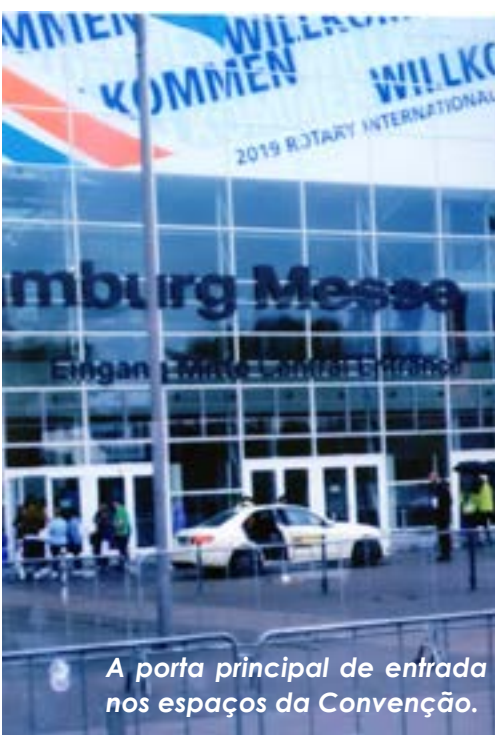
A porta principal de entrada nos espaços da Convenção.