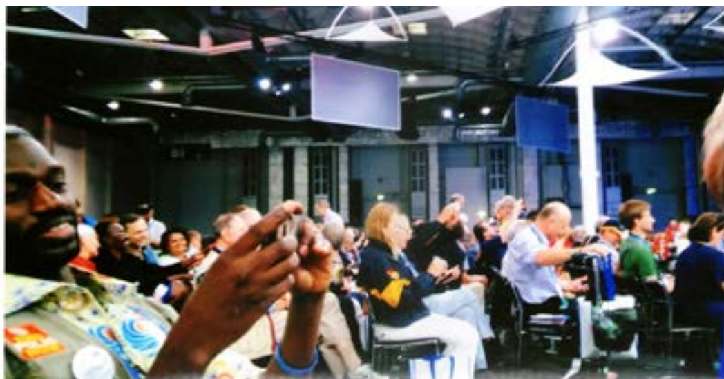
Numa das sessões plenárias.