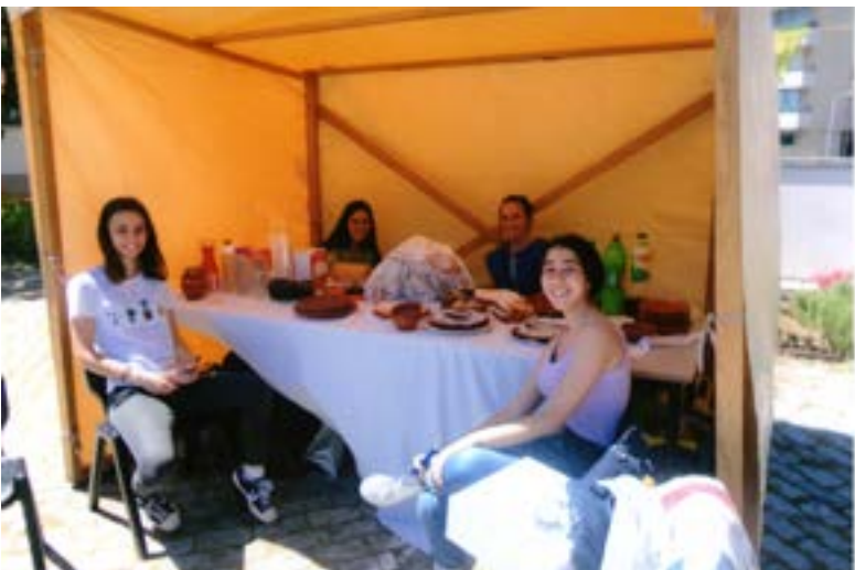
Elas (alguns dos Interactistas) no “stand” a aguardar visitantes.