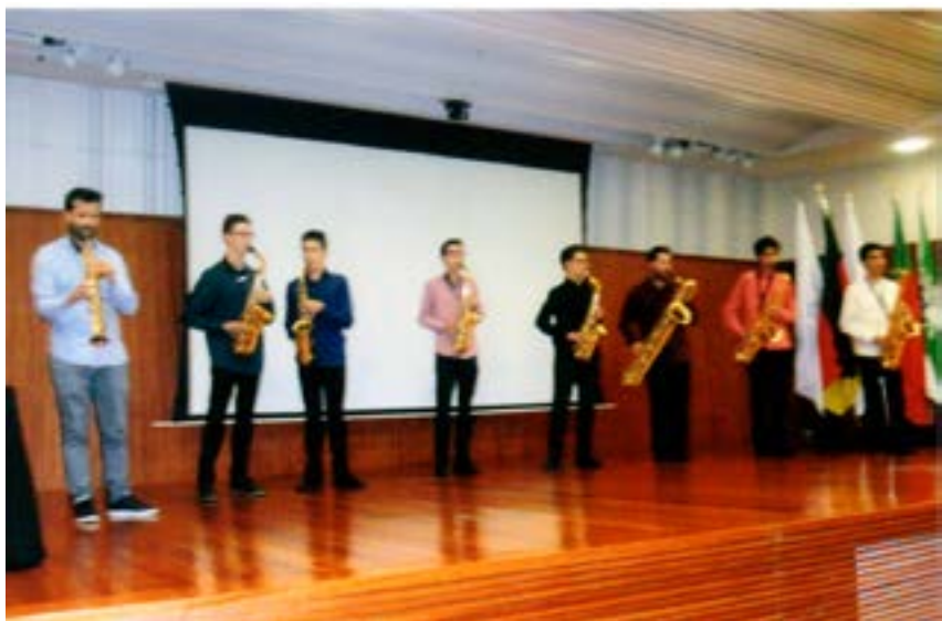
O Grupo de Saxofones actuando na sessão de abertura.