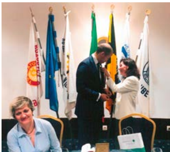
A Transmissão ela mesma!