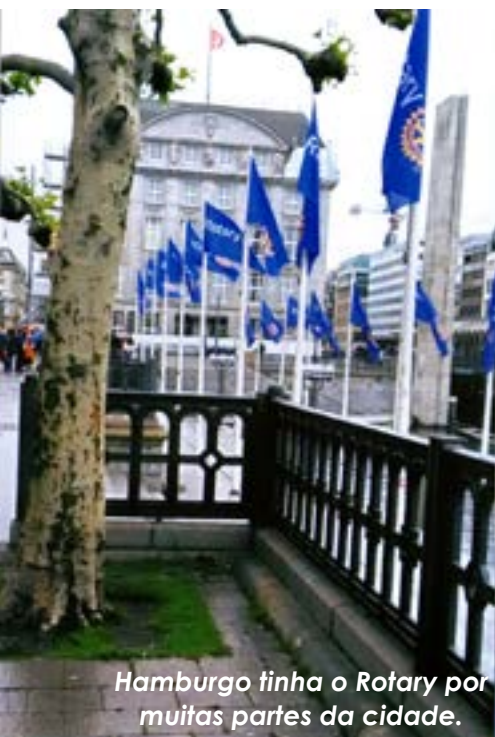
Hamburgo tinha o Rotary por muitas partes da cidade.