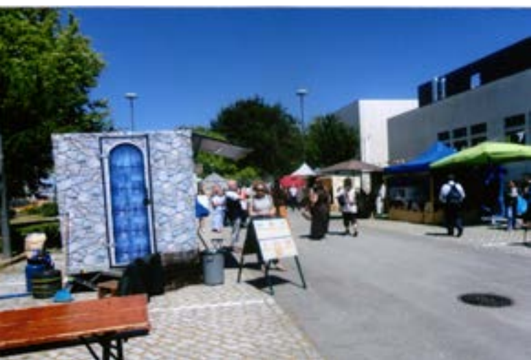
Um aspecto parcial da “Feira Medieval”.

Foi uma “Feira” movimentada e bastante frequentada que se desenrolou sobretudo nos dias 24 e 25 de Maio e que, no que se refere ao ITC, evidenciou uma vez mais a sua capacidade organizativa e constituiu oportunidade de falar de si mesmo.