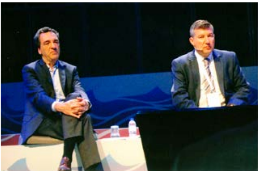
Os painéis tiveram a moderação do jornalista Júlio Magalhães.