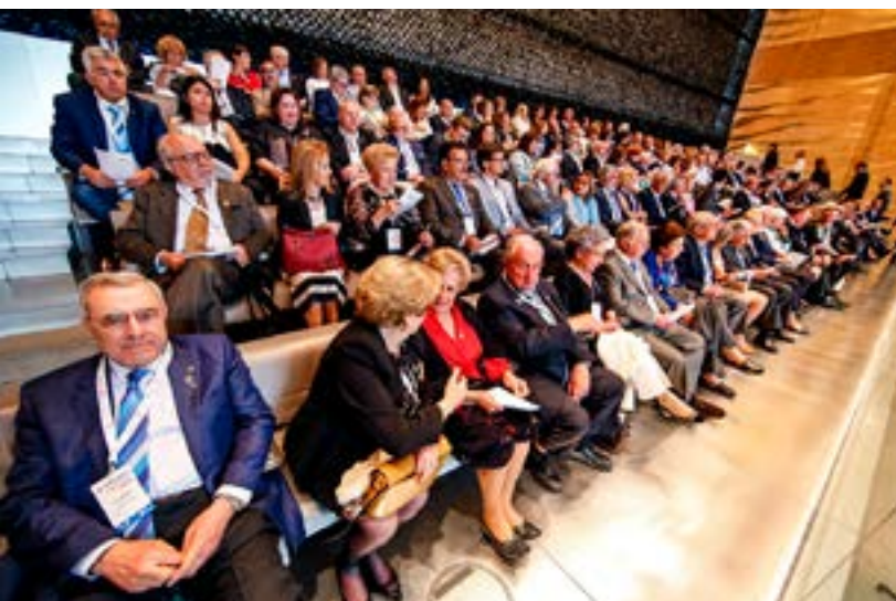
Um aspecto parcial da assistência.