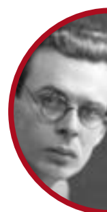
Friedrich Nietzsche (1844-1900)

"Por muito lentamente que nos pareça que passam as horas, parecer-nos-ão curtas se reflectirmos que não voltarão a passar."