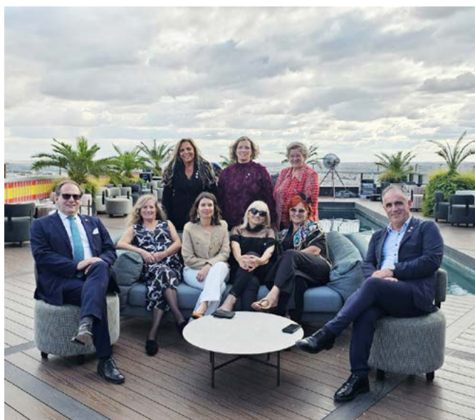
Á fresca do entardecer