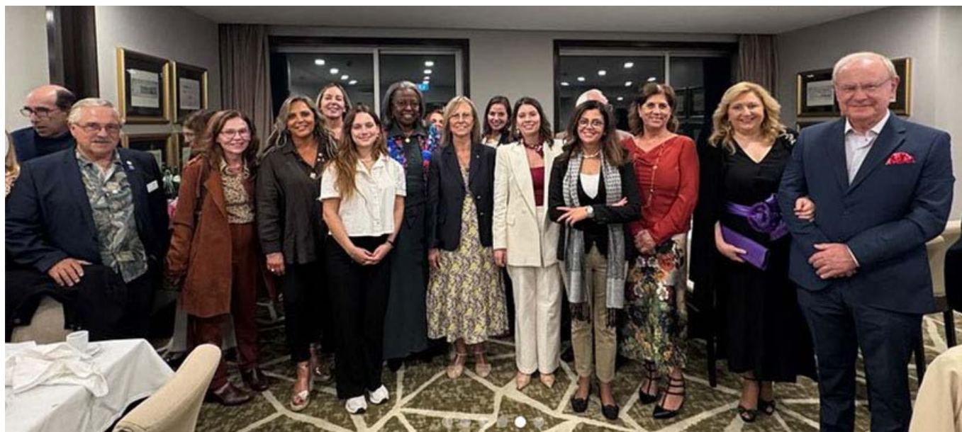
Na altura da reunião festiva de jantar.

Já à noite, e no 22º piso do Hotel HolidayInn Porto/Gaia (panorâmico), teve lugar um muito concorrido jantar de companheirismo em honra da Directora, em que em grande número os Rotary Clubes do nosso Distrito se fizeram representar.