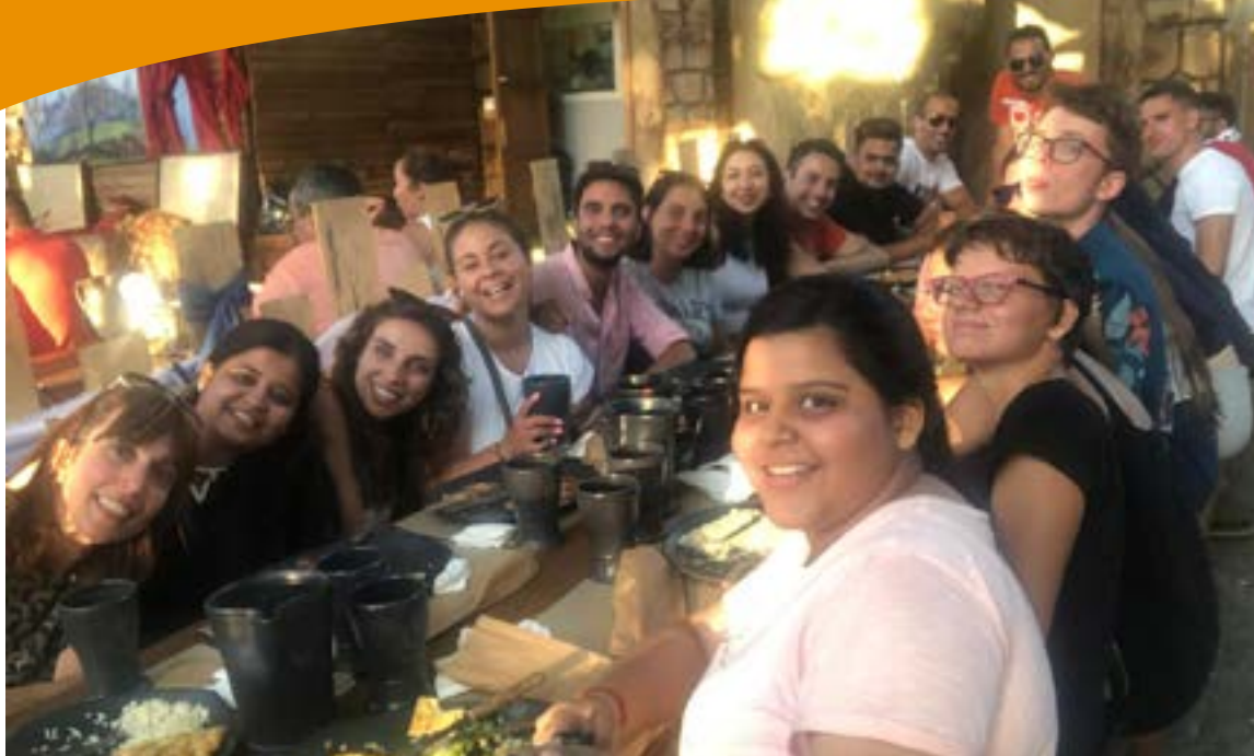
Um almoço "medieval", em Santa Maria da Feira,

O programa delineado foi muito feliz, rico e variado, proporcionando o contacto com várias belezas naturais e edificadas, assim como o contacto com as nossas realidades e as nossas gentes, seja na área do grande-Porto, seja em outras áreas de certo modo próximas, como Santa Maria da Feira (onde se divertiram com a sua incrível "Viagem Medieval") e Aveiro. Os jovens foram instalados na "The Gallery House" e beneficiaram de generoso apoio logístico do Holiday Inn Hotel, excelente estabelecimento hoteleiro onde, aliás, teve lugar o seu primeiro encontro, como o "Welcome Party". Do programa fizeram parte, na cidade do Porto, visitas à Igreja e Torre dos Clérigos, à Câmara Municipal e à Estação de S. Bento, à Sé e ao Palácio da Bolsa e, por fim, ao Parque da Cidade. Na área do