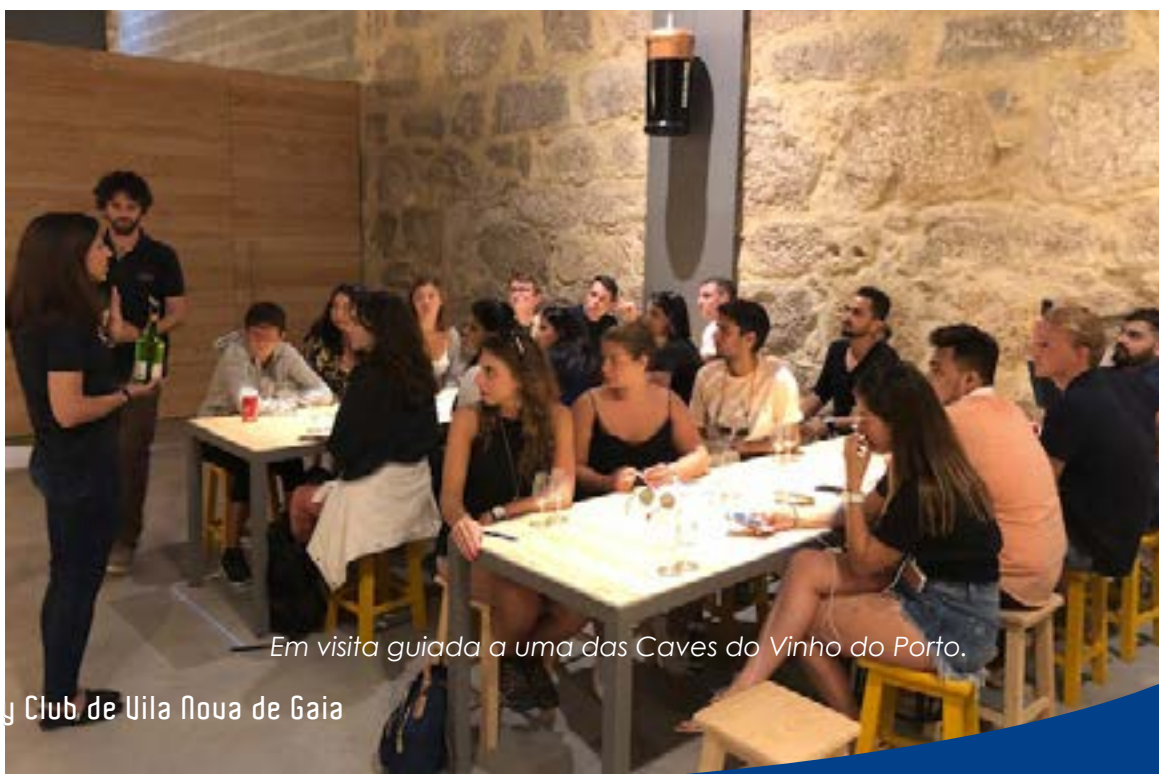
Em visita guiada a uma das Caves do Vinho do Porto.