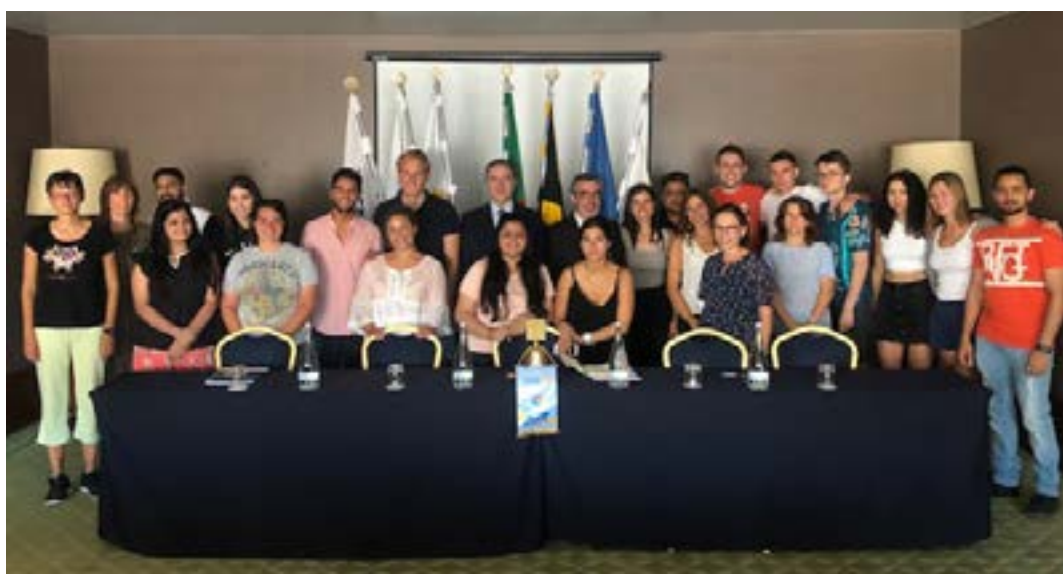
Foto do grupo.

T inha sido um assinalável êxito a edição do ano passado do “nosso” PORTUS CALLE CAMP, uma iniciativa inovadora então e mesmo arrojada na qual houve alguma comparticipação de mais três Rotary Clubes do nosso Distrito: os Rotary Clubes de Arouca, Vila Real e Porto. Além do nosso próprio Clube, claro.