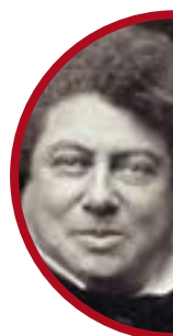
Vergílio Ferreira (1916-1996)

"Nos negócios não existem amigos, apenas clientes".