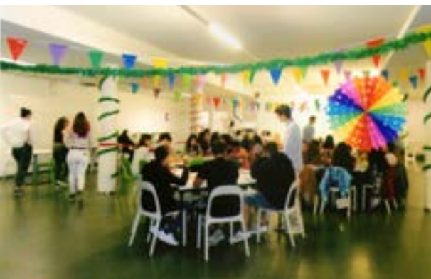
Um aspecto geral da sala de jantar.

Mal tinha começado o actual ano e o "ESAS" já estava noutra: organização de um jantar/festa para angariação de fundos em ajuda quer do Projecto "Amélia" (já tivemos ocasião de referir do que se trata), quer para deslocação de alguns a Taizé.