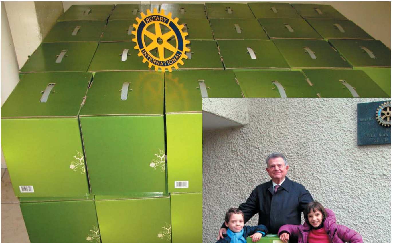
um aspecto parcial dos volumes que foram distribuídos.

Uma nova distribuição de mais de uma centena de volumes cheios de géneros alimentares de primeira necessidade foi feita pelo nosso Clube por famílias atingidas por situação de poucos recursos e por uma ou outra Instituição de solidariedade social, a exemplo do que já tínhamos feito na altura da época do Natal. O nosso Clube foi, para o efeito, contemplado com um Subsídio Distrital aprovado pela Comissão Distrital da Fundação Rotária de R.L.. Demos, assim, uma pequena ajuda à importante luta contra a pobreza.