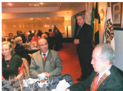
... e a do Sr. Presidente da Câmara Municipal.