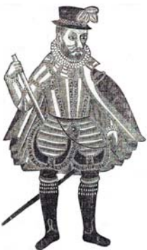
DON DIEGO DE MENESES.

Um valoroso militar que foi Governador da Índia entre 1576 e 1580. Tendo regressado a Portugal, tomou partido pelas pretensões de D. António Prior do Crato, quanto a subir ao trono por morte do Cardeal D. Henrique. D. António confiou-lhe a defesa e o governo da praça de Cascais, que defendeu com absoluta bravura dos ataques das forças do Duque de Alba. Recusou a capitulação e, tendo acabado por ser feito prisioneiro, foi decapitado por ordem do Duque em 1580.