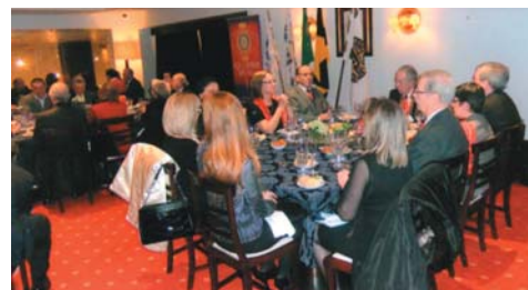
Um aspecto parcial da sala do jantar festivo, especialmente da Mesa da Presidência.